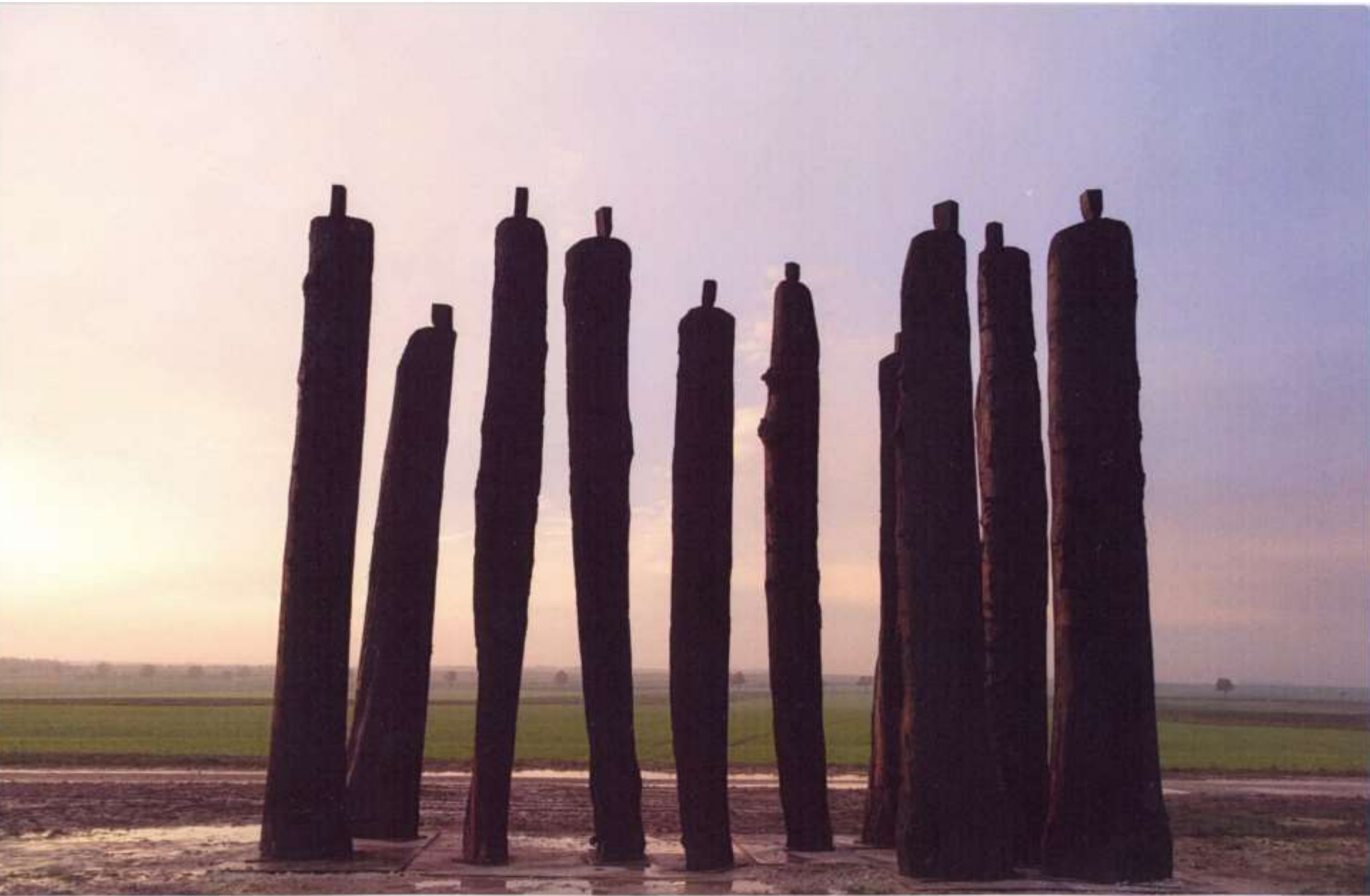
Christian Lapie La constellation du vent , 2013 11 figures de 6,2 à 5,3 m Chêne traité